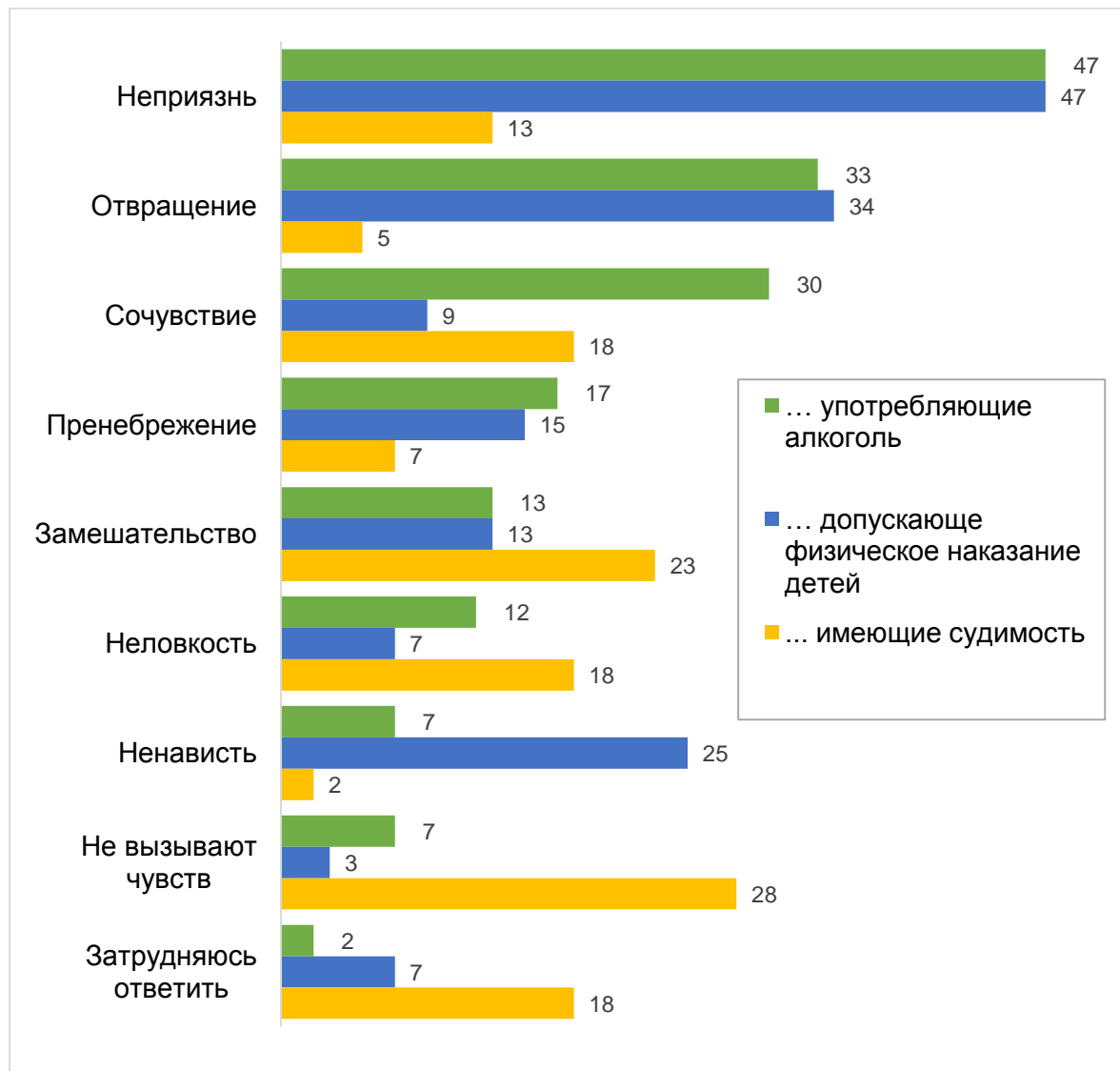
Диаграмма 2 – распределение ответов на вопрос «Какие чувства обычно у Вас вызывают родители...». Приведены только те ответы, по которым мнения череповчан существенно отличаются, данные в % от числа полученных ответов

Для того, чтобы подробнее рассмотреть возможные взаимоотношения с девиантными родителями, мы использовали метод изучения социальной дистанции Эмори Богардуса, который позволяет оценить степень социально-психологического принятия людьми друг друга. Результаты оценки позволяют утверждать, что жители города придерживаются максимальной социальной дистанции с родителями, имеющими алкогольную зависимость, допускающими физическое наказание своих детей или имеющих судимость. Как показало исследование, дистанцирование в отношении данных граждан не зависит от пола, возраста, уровня образования или сферы деятельности респондентов. На степень допустимости отношений влияет только «размер» негативного поведения исследуемых родителей.