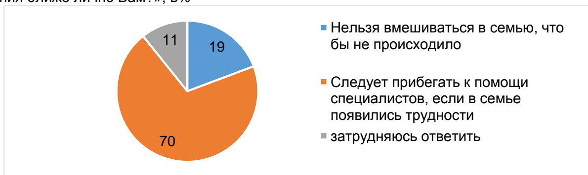
Диаграмма 6 - Распределение ответов на вопрос «Кто, по Вашему мнению, может вмешиваться в семью?», в % от числа ответов

Диаграмма 5 – Распределение ответов на вопрос «Существуют разные точки зрения. Одни считают: нельзя вмешиваться в семью, что бы в ней не происходило, другие уверены в том, что нужно прибегать к помощи специалистов, если в семье появились трудности. Какая точка зрения ближе лично Вам?», в %