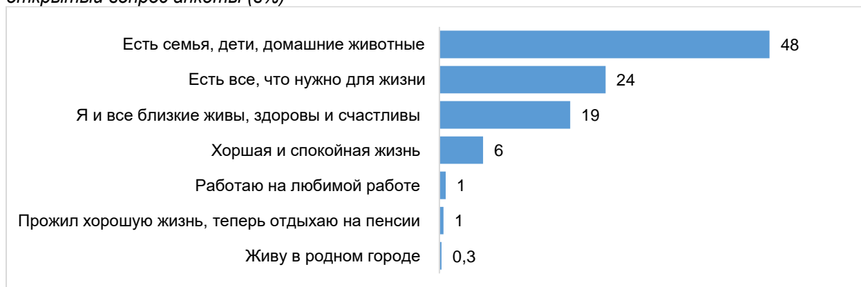
Диаграмма 2 – Если Вы ощущаете себя счастливым, то почему? Распределение ответов на открытый вопрос анкеты (в%)

В настоящее время во всем мире наблюдаются негативные последствия пандемии, ярко выражающиеся в экономическом кризисе, росте числа безработных, снижению доступа к образовательным, медицинским, культурным услугам. Вместе с внешними проявлениями, присутствует ухудшение взаимоотношений в семьях. «По данным американских центров, в семьях растет число ссор и драк. Директор Федерального ведомства по уголовным делам ФРГ прогнозирует, что насилие в семье в отношении детей, пожилых родителей может стать серьезной проблемой в ближайшие несколько лет. В Китае наблюдается бум разводов, в Великобритании каждый 10-й склонен расстаться, развестись после окончания карантина» 2 .