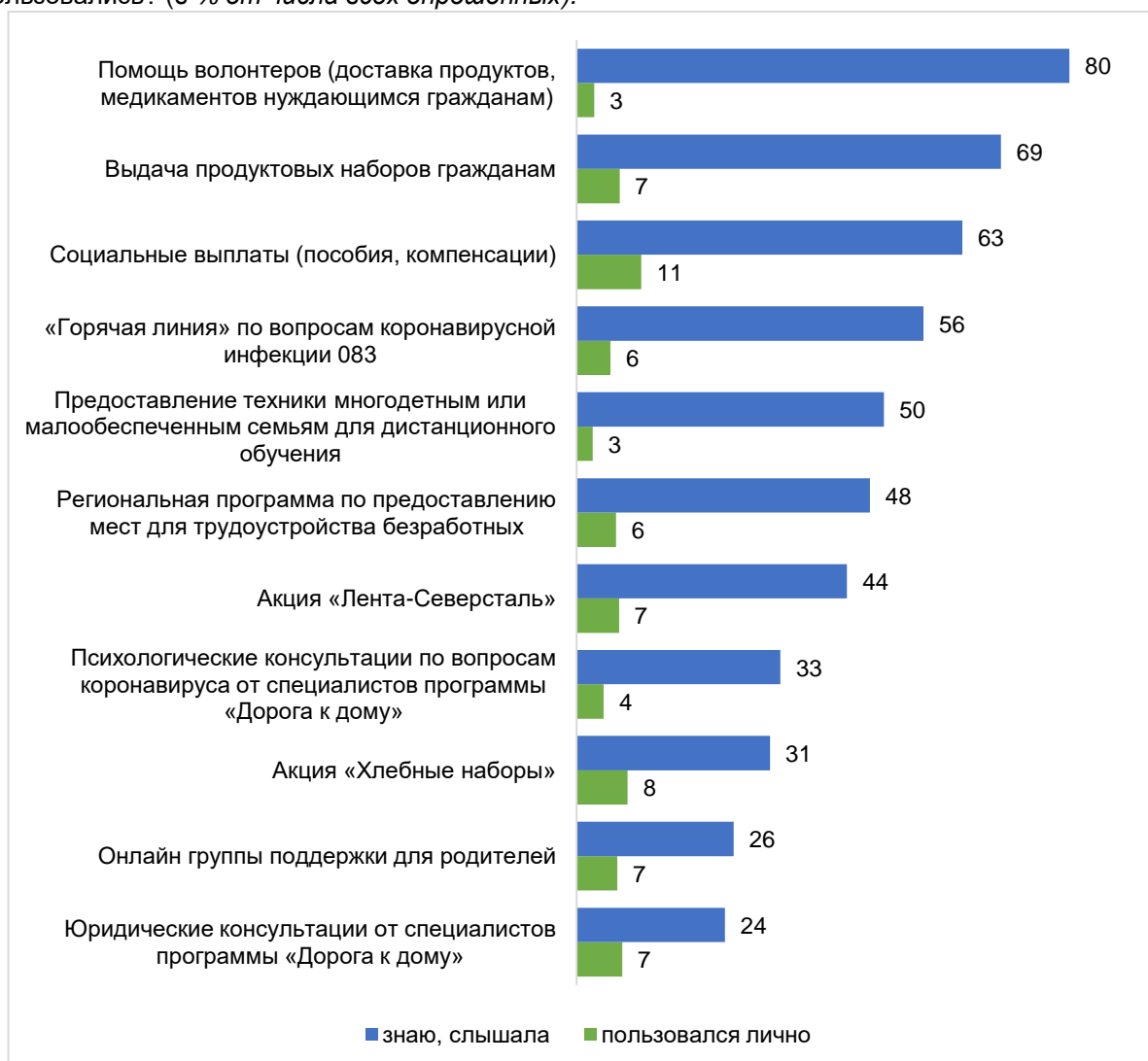
Диаграмма 7 – О каких мерах поддержки горожан во время пандемии Вы слышали? Какими пользовались? (в % от числа всех опрошенных).