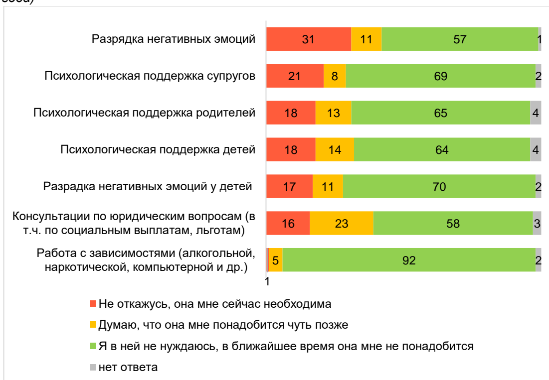
Диаграмма 6 – От какого из перечисленных видов поддержки Вы бы не отказались? (в % по данным 2015 года)

Чтобы помочь горожанам во время пандемии власти, представители бизнеса и некоммерческого сектора Череповца предлагали различные виды поддержки. 84% горожан так или иначе информированы или пользовались предлагаемыми мерами поддержки. Как показал опрос, информированность горожан о способах поддержки высокая, но воспользовались мерами не больше 10% . Среди причин может быть, как сложность в получении перечисленной поддержки, так и неактуальность предлагаемых мер. Самыми известными мерами стали помощь волонтеров нуждающимся череповчанам в доставке продуктов питания и медикаментов (80% слышали о данной виде помощи), выдача продуктовых наборов (69% соответственно), социальные денежные выплаты (63%). Наиболее востребованными оказались социальные выплаты (11% участников исследования получили выплаты). Подробнее – на диаграмме 5.