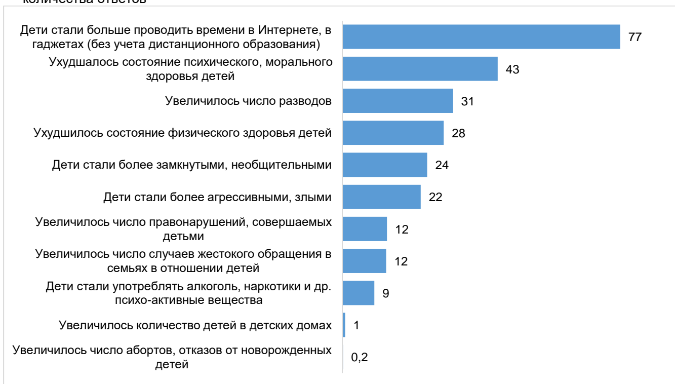
Диаграмма 4 – Как Вы считаете, какие проблемы усилились во время пандемии в Череповце? в % от количества ответов

Кто обеспокоен наиболее острыми проблемами в Череповце.