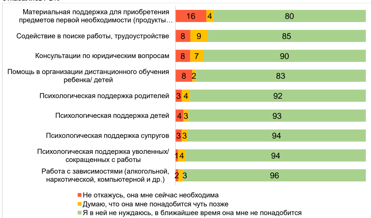
Диаграмма 5 – От какого из перечисленных видов поддержки в настоящий момент Вы бы не отказались? в%

В сложное для всех время людям необходима поддержка. Среди выделенного списка 5 большинство респондентов (20%) нуждаются в материальной поддержке для приобретения предметов первой необходимости, 17% нуждаются в содействии в поиске работы , трудоустройстве, 15% - в юридических консультациях . Полное распределение ответов на диаграмме 5.